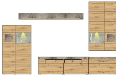
10 J1 HH 80