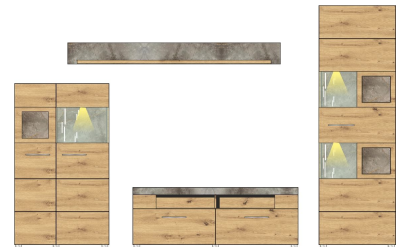
10 J1 HH 81