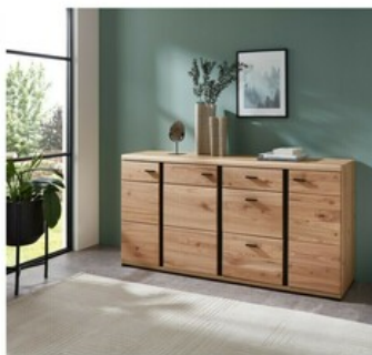
25 ca. 173/86/42 cm