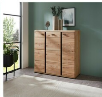
26 ca. 124/120/42 cm