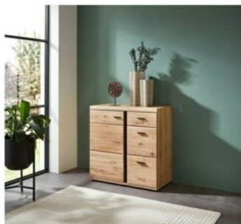
23 ca. 85/86/42 cm