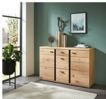
24 ca. 134/86/42 cm